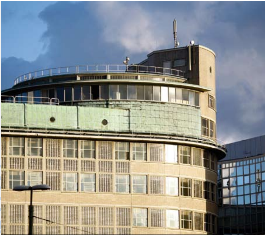
Stationspostkantoor, Den Haag.

heilzaam is om gevangenen op te sluiten in cellen, zodat ze in alle eenzaamheid hun fouten kunnen overdenken. De architect moet nu gevangnissen ontwerpen waarin vanuit een centrale plek al die cellen snel zijn te overzien. De Haarlemse koepelgevangenis (1902) van de in Delft afgestudeerde Metzelaar junior geldt als één van de bekendste voorbeelden.