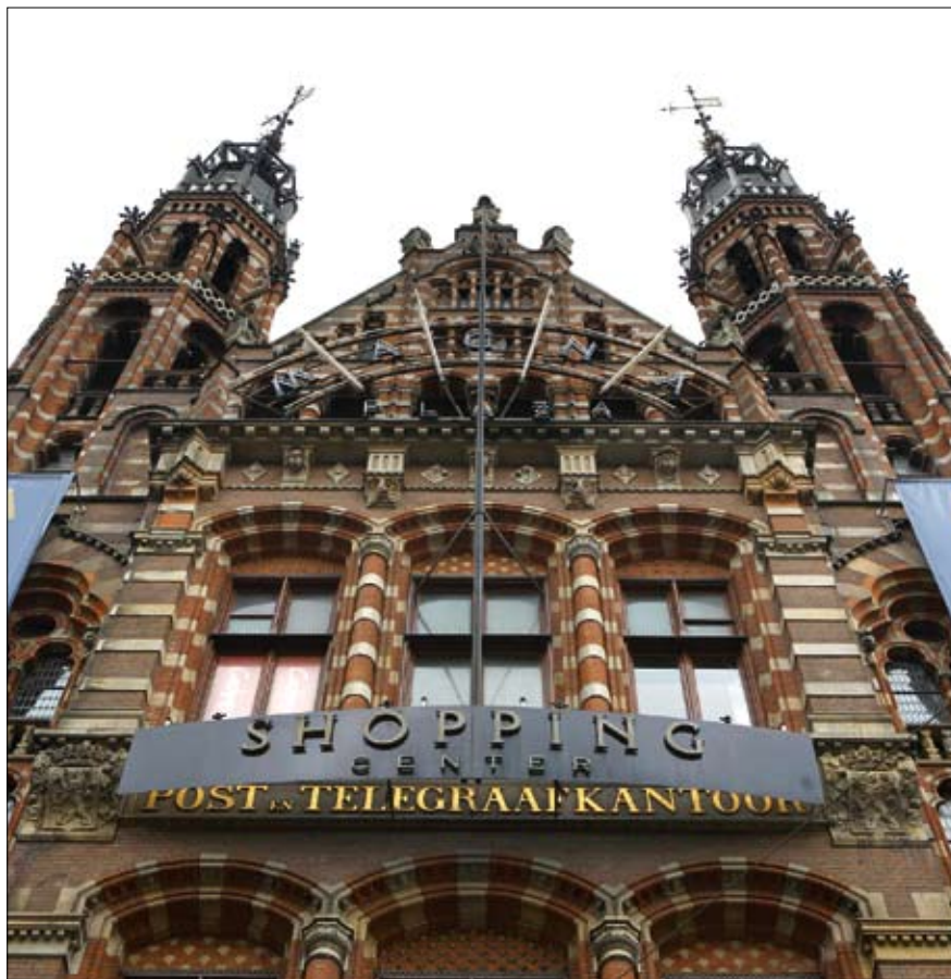
Magna Plaza, voormalig Hoofdpostkantoor, Amsterdam.

Aan het Rijksbouwmeesterschap van Friedhoff kleefde iets tragisch. Hij is de allerlaatste Rijksbouwmeester