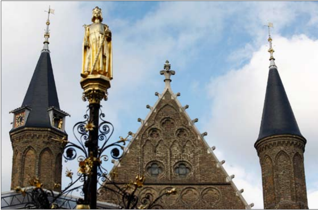
Binnenhof, 'De Ridderzaal', Den Haag.

te geven – krijgt hij bittere kritiek. Zeker wanneer het houten dak achteraf niet uit de zestiende, maar de dertiende eeuw blijkt te stammen. Op het hoofd van de waardige Ridderzaal is 'een ware zotskap' geplaatst, zo honen de critici. Als twaalf jaar later een exacte replica van het originele dak op de Ridderzaal wordt geplaatst, is Rose al jaren weg als rijksarchitect. Een opvolger is er niet, daarvoor is zijn Rijksbouwmeesterschap te veel op een fiasco uitgelopen. Zijn plannen voor een grondige vernieuwing van het Binnenhof zullen nooit worden gerealiseerd.